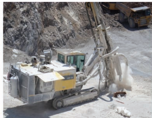
Προς αποφυγή! Όρνυξη επιπλέον διατρημάτων κατά τη διάρκεια της γόμωσης (διακρίνονται τα υλικά δίπλα στα διατρήματα)