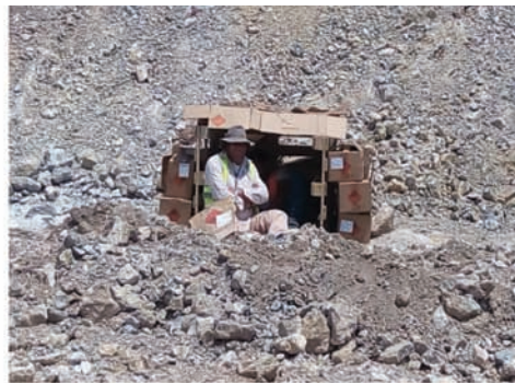
Μια διαφορετική προσέγγιση στο θέμα της διαχείρισης των άδειων συσκευασιών