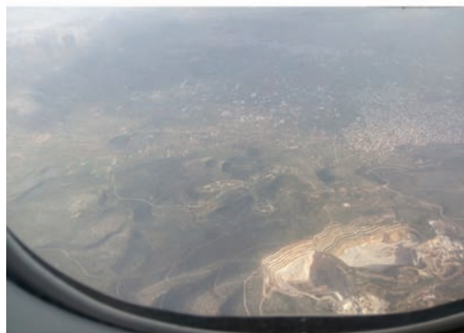
Τα λατομεία της ανατολικής Αττικής από ψηλά