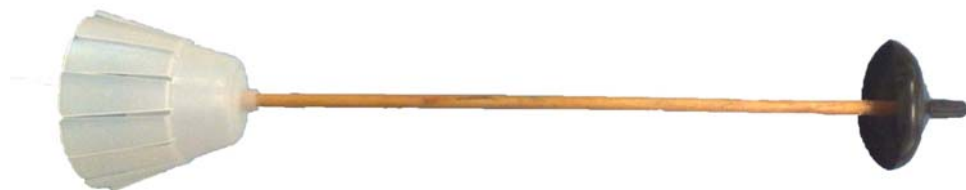
Το σύστημα Power Deck™ Plug

Οι ανατινάξεις με την χρήση ειδικού τύπου τάπας που δημιουργεί κενό αέρα στο κάτω μέρος του διατρήματος έγιναν με το σύστημα Power Deck™ Plug. Αυτή η ειδική τάπα αποτελείται από μια ξύλινη ράβδο, ένα εύκαμπτο πλαστικό σε σχήμα τουλίπας στο πάνω μέρος και ένα μικρότερο μαλακό πλαστικό στο κάτω μέρος.